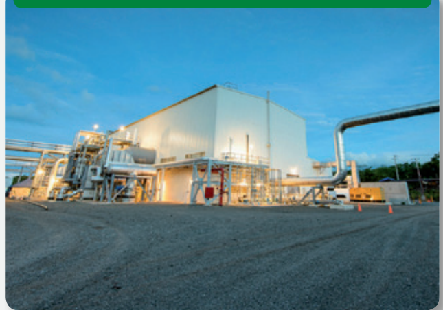
Central geotérmica San Jacinto (Nicaragua). Foto cortesía de Polaris Energy Nicaragua | Kraftwerkgesellschaft Traunreut GmbH San Jacinto geothermal power plant (Nicaragua). Photo courtesy of Polaris Energy Nicaragua

PCA. Costa Rica is accelerating its geothermal development with two plants in the pipeline, an extension at Las Pailas and the new Borinquen development. Once completed, the plants will add 165 MW in operating capacity by 2024. In addition, Polaris Infrastructure announced it was adding a 10 MW well to its San Jacinto plant in Nicaragua, which opened in a phased approach during 2016. Partial funding from the United States Trade Development Agency (USTDA) and expertise from Dewhurst Group, LLC, facilitated Colombia's utility company EPM to finalise and publish their feasibility study for the Nevado del Ruiz project. The report was completed in spring 2016.