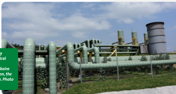
Nairobi, Kenia, complejo geotérmico y central eléctrica Olkaria, primera central eléctrica geotérmica de África. Foto cortesía de IRENA | Nairobi, Kenya, Olkaria geothermal complex and power station, the first geothermal power plant in Africa. Photo courtesy of IRENA

Croacia ha comenzado a desarrollar su primera central geotérmica en la Cuenca Panoniana con una potencia estimada de 10 MW. Las turbinas de la planta serán suministradas por Turboden. Se espera que entre en operación comercial en mayo de 2017. En Croacia, las plantas geotérmicas