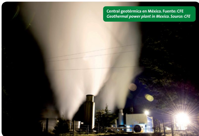
Central geotérmica en México. Geothermal power plant in Mexico.

marzo (212 MW agregados), es emocionante ver a Malasia entrar en el mercado. Tawau Green Energy ha tomado la iniciativa de desarrollar la primera planta geotérmica de Malasia en Apas Kiri-Tawau. La planta binaria de 30 MW utilizará turbinas de Exergy y se espera que alcance la operación comercial para junio de 2018. En mayo de 2015, se anunciaron los niveles de tarifas de inyección a red para las plantas geotérmicas de Malasia. Las plantas de hasta 30 MW son elegibles para una tarifa de 0,45 MYR/kWh.